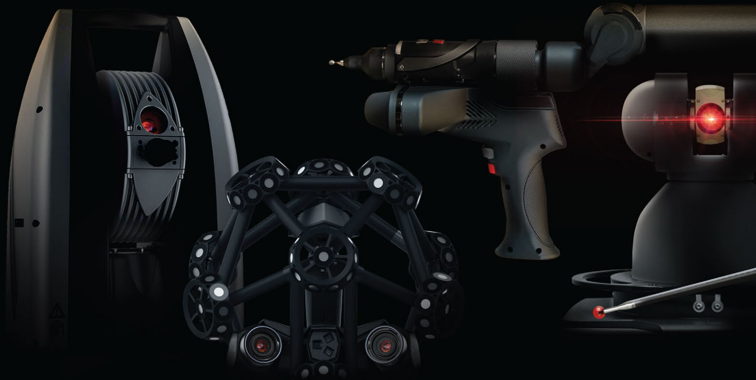
PLATE-FORME DE MÉTROLOGIE PORTABLE DE PREMIER PLAN

Réputé pour la puissance et la stabilité de ses interfaces matérielles directes, PolyWorks | Inspector offre un vaste ensemble de technologies de guidage qu'utilisent les plus grands fabricants d'équipement internationaux pour implanter des procédés de mesure efficaces, précis et répétables pour leurs dispositifs de métrologie portable.